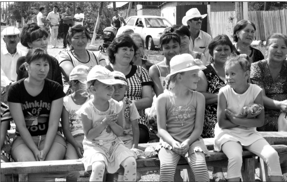
Земля моих предков, Край мой любимый, Тобою по праву всегда я горжусь, Здесь каждый пригорок овеян былиной И светится сердце. Великая Русь!

Мероприятия посвящённые Дню села вновь зашагали по Варненскому району. 17 июля жители